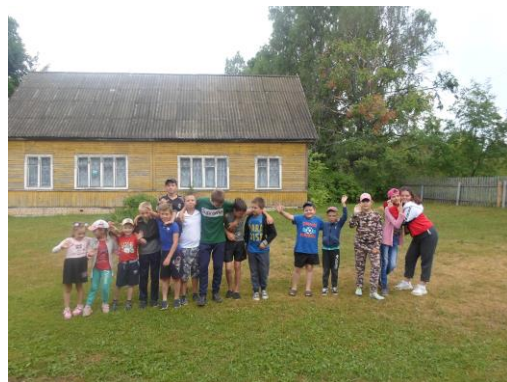
Жить здорово! (ЛОЛ)